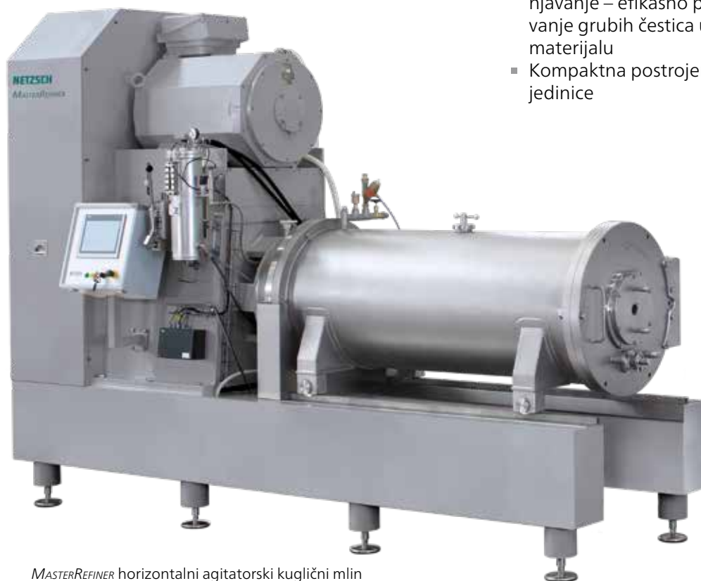
MASTERREFINER horizontalni agitatorski kuglični mlin