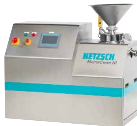
NETZSCH MASTERCREAM s kontrolnom jedinicom