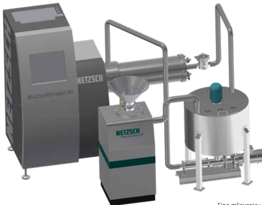
Fino mljevenje u kontinuiranom procesu s horizontalnim agitatorskim kugličnim mlinom MASTERREFINER

Proizvodni kapacitet postrojenja ovisan je s jedne strane o veličini korištenog MASTERREFINER horizontalnog agitatorskog kugličnog mlina, a s druge strane znatno ovisi o inicijalnoj finoći korištenog šećera. Ovaj odnos prikazan je u niže navedenoj tablici.