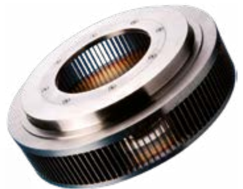
Classificatore fine ad alte prestazioni NETZSCH INLINES STAR