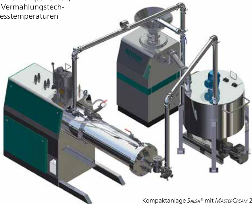
Kompaktanlage SALSA ® mit MASTERCREAM 20