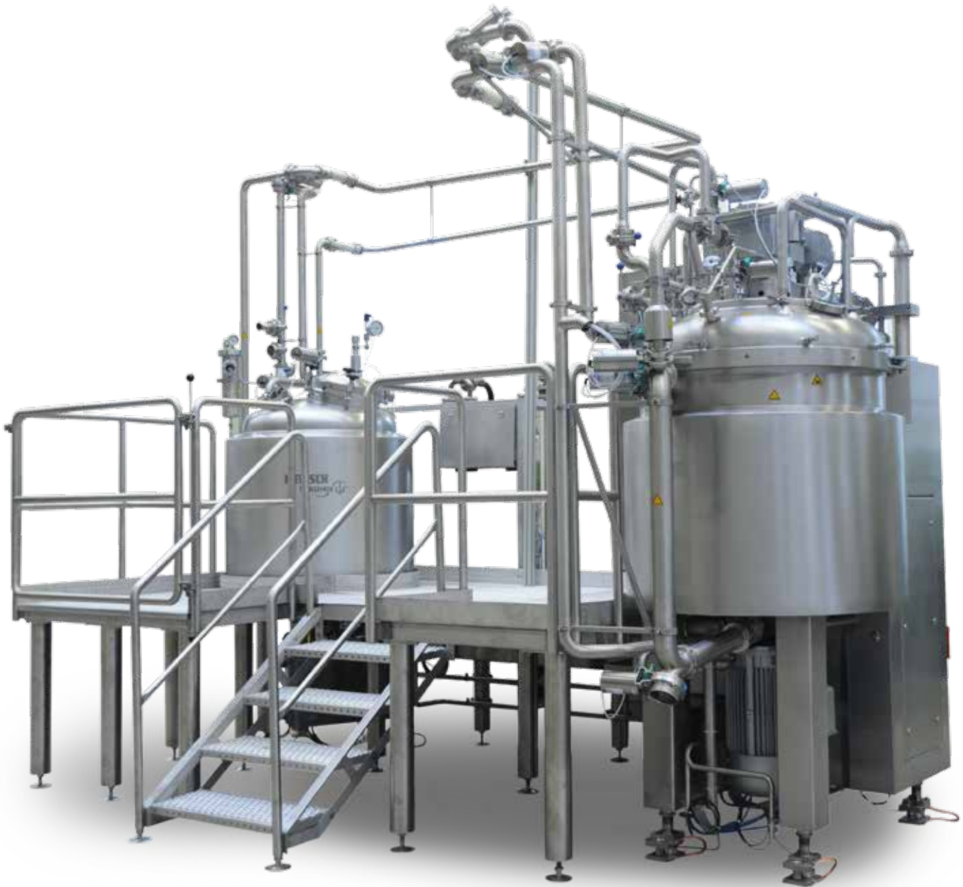
Homogenisiermischer KAPPAVITA ® HM 500 mit einem Ansatzbehälter GAMMAVITA ® 500