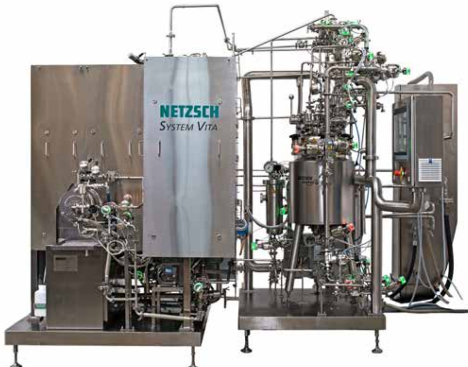
System VITA ®, bestehend aus einer Rührwerkskugelmühle DELTAVITA ® 2000 und einem Ansatzbehälter GAMMAVITA ® 60