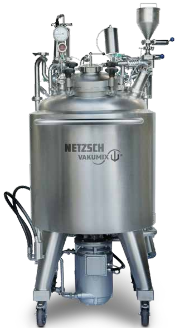
GAMMAVITA® 300 – fahrbar