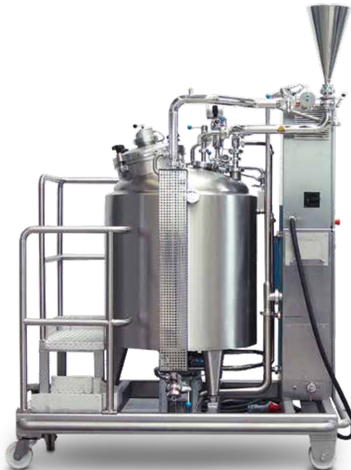
GAMMAVITA ® 275 – fahrbar mit Arbeitsbühne

Alle GAMMAVITA ®-Maschinenausführungen sind optional auch mit anderen Rührwerkstypen verfügbar - beispielsweise mit Magnetrührwerk oder dem NETZSCH Vakumix Easy Visco.