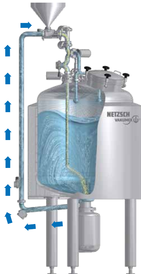
Mischen über die Umlaufleitung und Einsaugen von Pulverstoffen