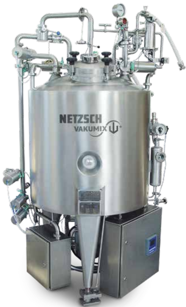
GAMMAVITA® 140 – mit Wägezellen