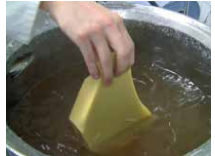
Schmelzen von Wachsblöcken

patentiertes Umlaufrührwerk mit Fräskopf