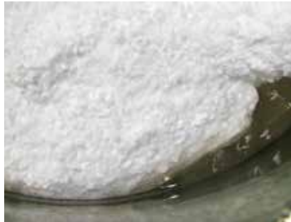
Schmelzen von Wachspellets