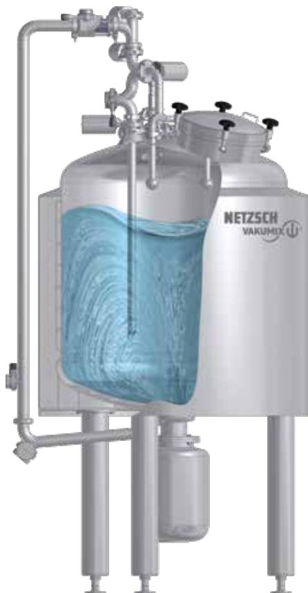
Mischen innerhalb des Behälters