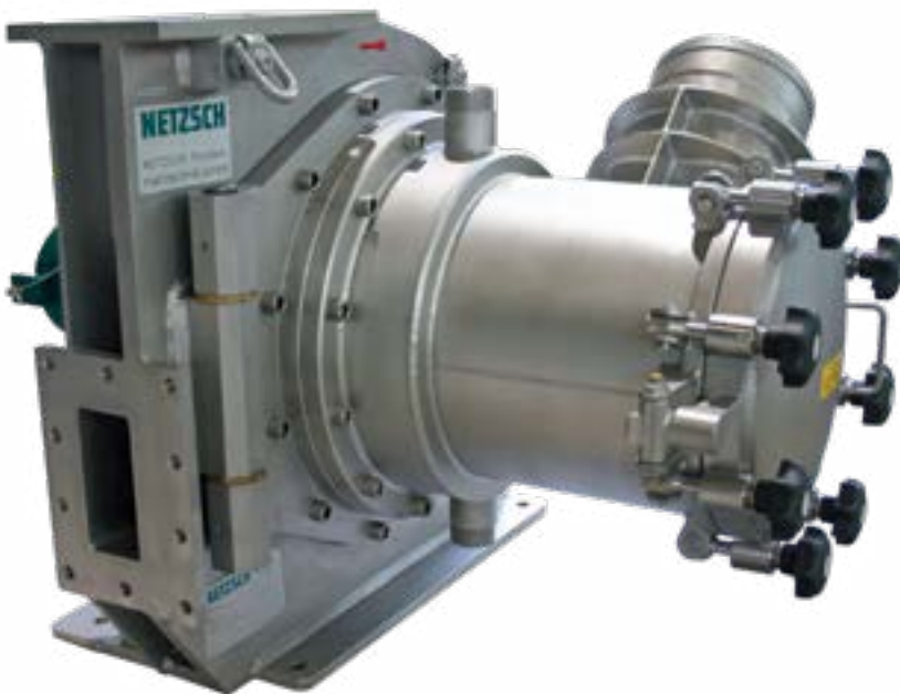
NETZSCH Hochleistungsfein- sichter INLINESTAR